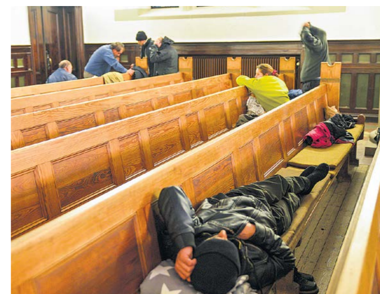
Turvapaikanhakijat ovat levittäneet patjansa kirkon penkeille.