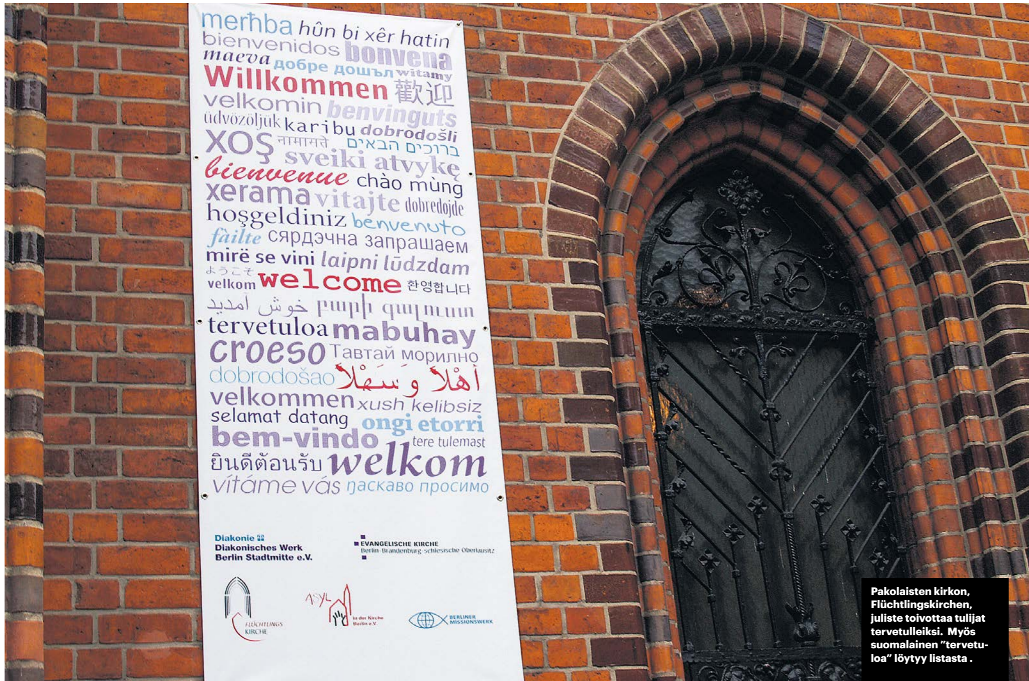
Pakolaisten kirkon, Flüchtlingskirchen, juliste toivottaa tulijat tervetulleiksi. Myös suomalainen "tervetuloa" löytyy listasta.

Kirkko puolustautui sanoen, että myöntämällä turvapaikkoja se haluaa varmistaa, että valtiolta tekee oikeita päätöksiä. Kirkon suojeluksessa olevien henkilöiden tapaukset